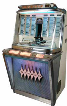
Il Juke Box Corale di Numana