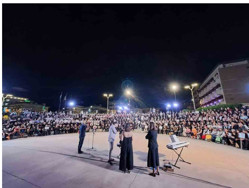
L'incontro Polifonico Internazionale "Città di Fano"